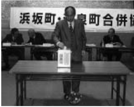
⇒第一次選考の様子

今回の合併協議会では、募集要領に基づいて、選定が行われましたが、名称の種類321点の中に現在、他の町が使用している同一の名称・読み仮名が5点ありましたので、選定から除外いたしました。