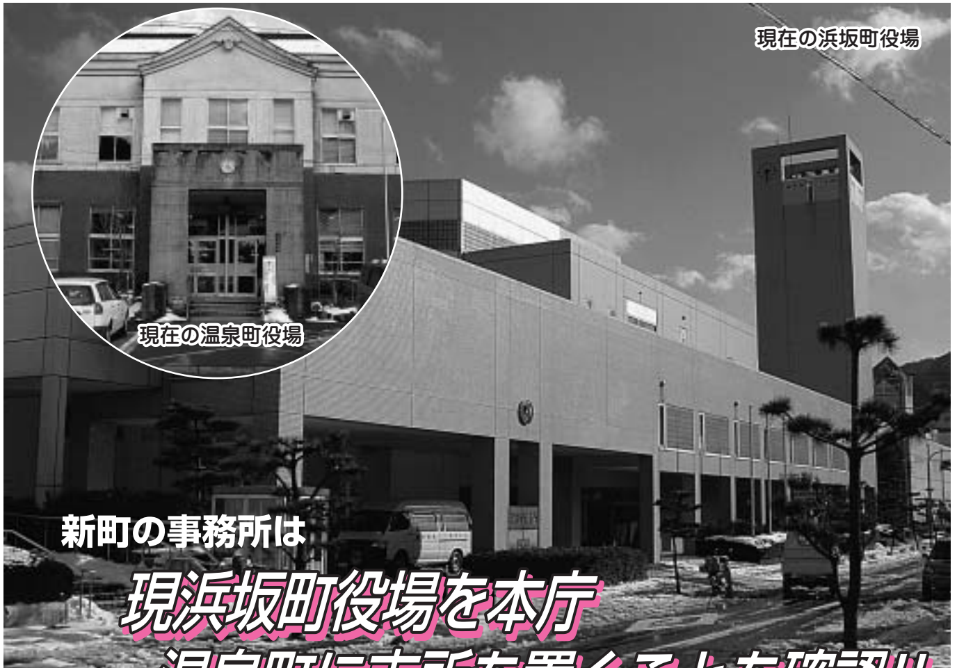
現在の浜坂町役場