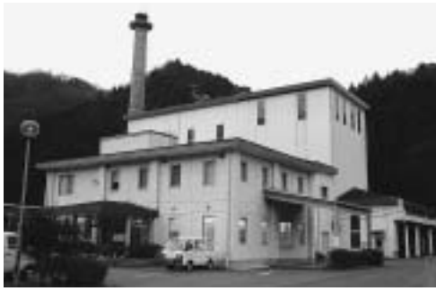
▲2町で運営している美西衛生施設一部事務組合

4. 地方自治法の規定による協議会等については、法令に基づき所定の手続きを行う。